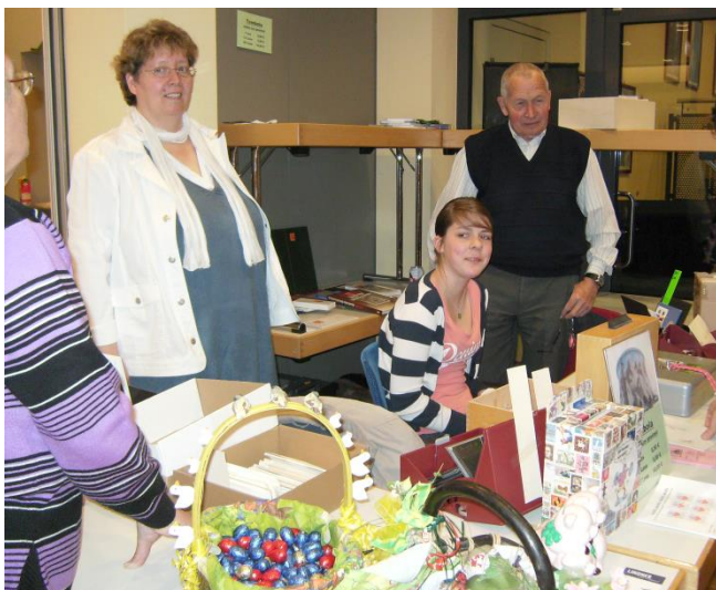
Fast 300 Besucher beim 42. Grenzlandtauschtag; 600 Lose der Tombola der Jugendgruppe schon nach 2 ½ Std. ausverkauft