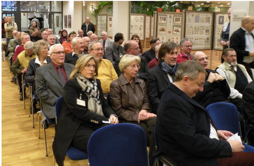
Feierliche Eröffnung der KEVELAER 2013