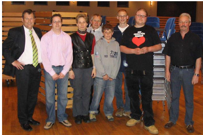
Tatkräftige Helfer aus Jugend- und Erwachsenengruppe sorgen jedes Jahr für den schnellen Auf- und Abbau beim Grenzlandtauschtag im Bühnenhaus

Herausgabe der Vereinszeitschrift „Phila-Post“